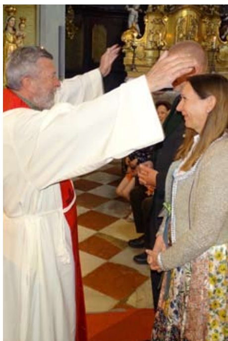
► Freude bei der Versöhnungsfeier im Rahmen der Erstkommunionvorbereitung im Klostergarten.